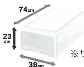
引き出し式衣装ケース

★このほか患者様に合わせて持ってきて頂くもの、お持ち帰り頂くものが出てくる場合があります。